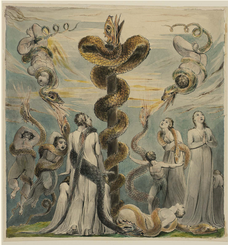
«Moses Erecting the Brazen Serpent». Maleri av William Blake fra omkring 1802. Vi ser at folkene rundt Moses har problemer med å sublimerer slangekraften.

Slanger spiller en sentral rolle også i flere av fortellingene om Moses. Evnen til å forvandle staven sin til en slange er selve tegnet på at Moses har blitt velsignet av Gud (Dette står i 2. Mos. Kap. 4; her viser staven til menneskets ryggsoyle, som går fra halebenet og opp til hodet).