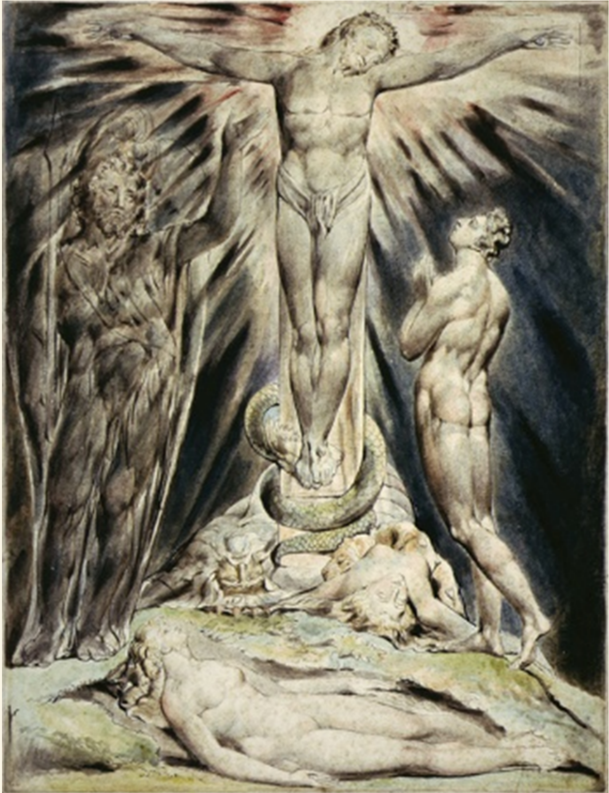
«Michael Foretells the Crucifixion», maleri av William Blake. Vi ser at Kristus fremstilles som en videreutvikling av slangen. Han står oppå slangen og nærmest vokser ut fra den.